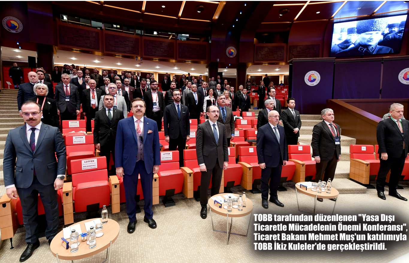
TOBB tarafından düzenlenen "Yasa Dışı Ticaretle Mücadelenin Önemi Konferansı", Ticaret Bakanı Mehmet Muş'un katılımıyla TOBB İkiz Kuleler'de gerçekleştirildi.

Türkiye Odalar ve Borsalar Birliği (TOBB) Başkanı M. Rifat Hisarcıkloğlu, vergi sisteminde köklü ve yapısal bir reforma ihtiyaç duyulduğunu belirterek, "Amacımız, hem daha düşük vergi oranları uygulaması hem de vergi sisteminin basit ve anlaşılabilir şekilde tasarlanması olmalıdır." dedi.