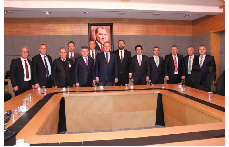
Sağlık Bakanı Dr. Mehmet Müezzinoğlu Ve Tekirdağ Milletvekillerini Ziyaretimiz (08.01.2016)