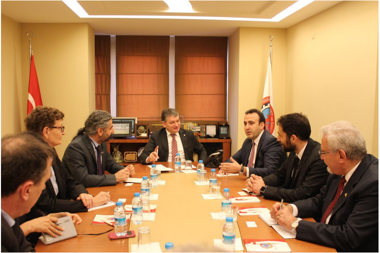
Trakya Kalkınma Ajansı ve AB Heyeti'nin Odamızı Ziyaretleri (14.01.2016)